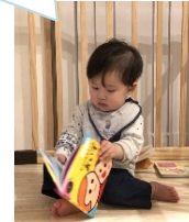
家庭での絵本読み活動