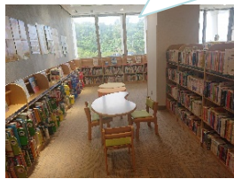
図書館で申し込みと受け取り(恩納村文化情報センター)