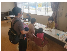
乳幼児健診で全受診者へ案内(恩納村総合保健福祉センター)